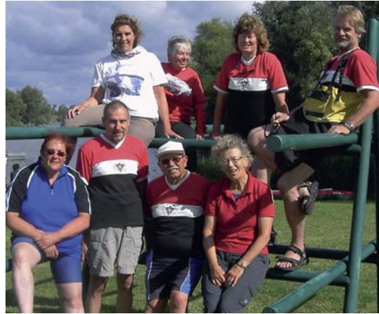
Ein Relikt aus der DDR: Ein Kanulagergestell am Zeltplatz – als Sitzgelegenheit ein wenig unbequem...