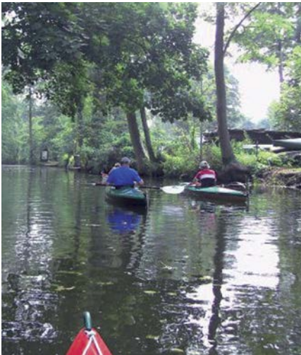
Auf den Kanälen des Spreewalds (l) Ein Stocherkahn (r)

Szenenwechsel: Zelte in, Boote auf die Autos und Transfer nach Potsdam. Wir waren bei den Wassersportfreunden Pirschheide zu Gast und hatten unsere Zelte ein paar Tage direkt am Havelufer stehen. Nun weiß jeder, daß man in Potsdam das Schloß und den Park Sanssouci gesehen haben muß, aber das ist längst nicht alles: Die UNESCO-Welterbestätten erstrecken sich bis nach Berlin, rechts und links der Havel. Meine Lieblingsstelle ist auf dem Jungferensee, kurz hinter der Glienicker Brücke, zwischen Schloß Cecilienhof und dem Park Babelsberg, mit Blick auf die Sacrower Heilandskirche und das Schloß auf der Pfaueninsel. Eine ideale Verknüpfung von