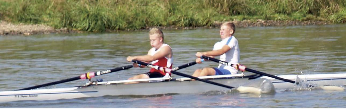
Mit voller Kraft Richtung Ziel