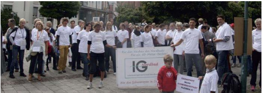
Sie wird weiter Druck aufbauen: die Interessengemeinschaft Nordbad