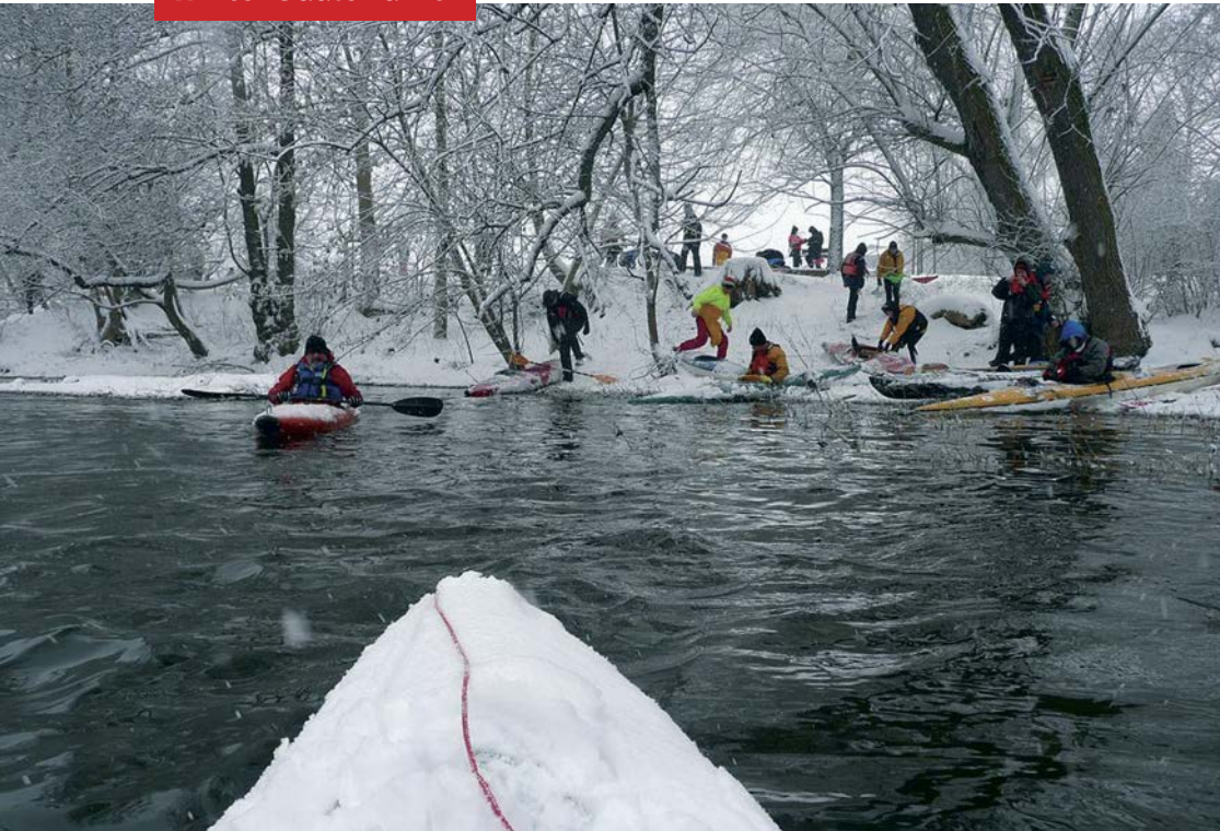
Winter Saale Fahrt