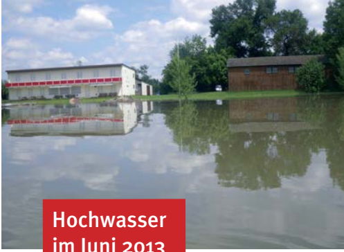
Hochwasser im Juni 2013