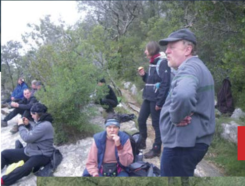
Chassesac zu Land