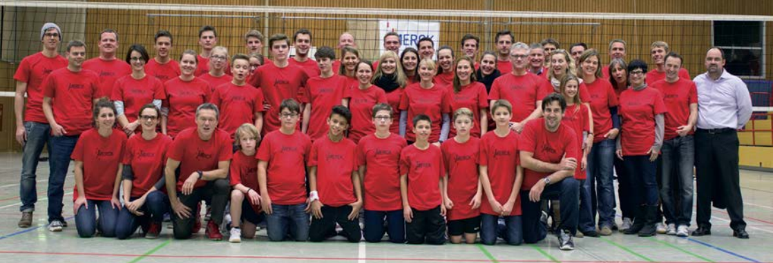
Freiwillige Helfer der letzten Schicht nach dem Länderspiel.