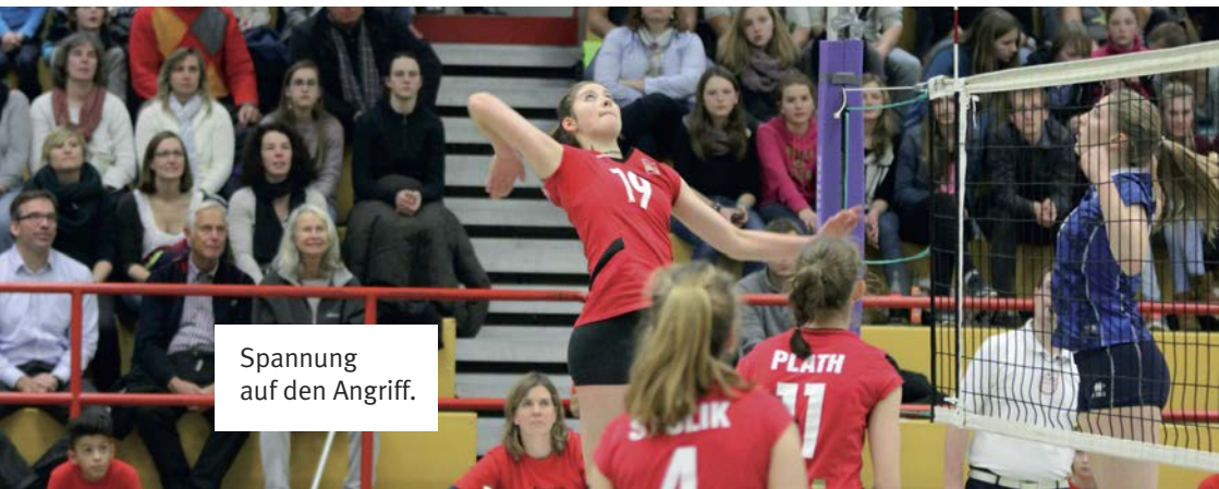
Spannung auf den Angriff.