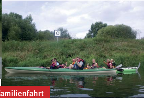
Familienfahrt an der Lahn