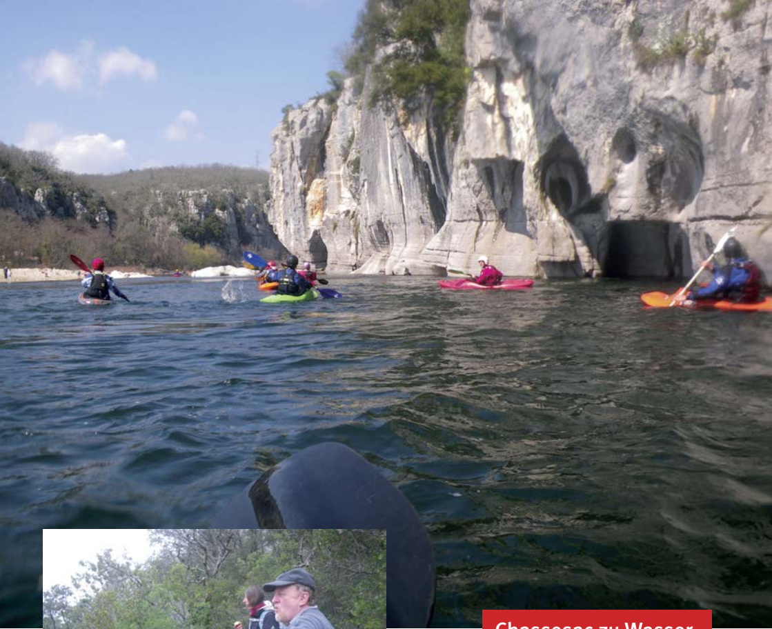
Chassesac zu Wasser