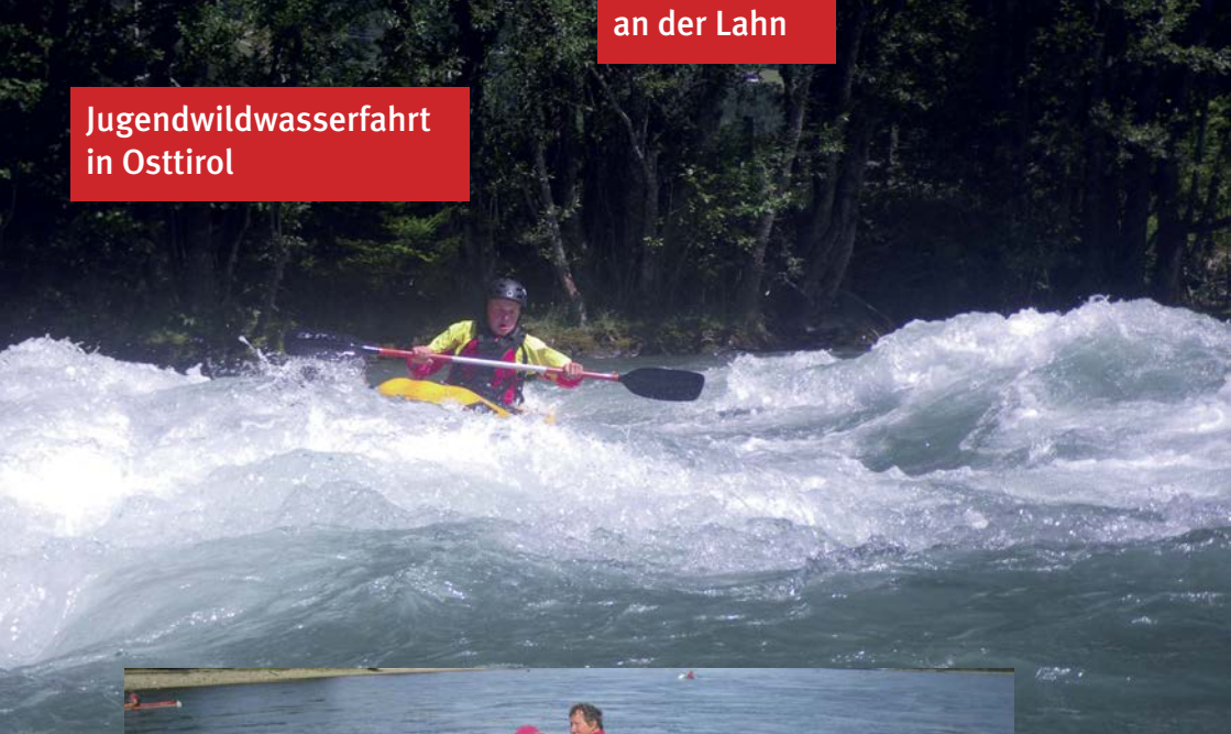
Jugendwildwasserfahrt in Osttirol