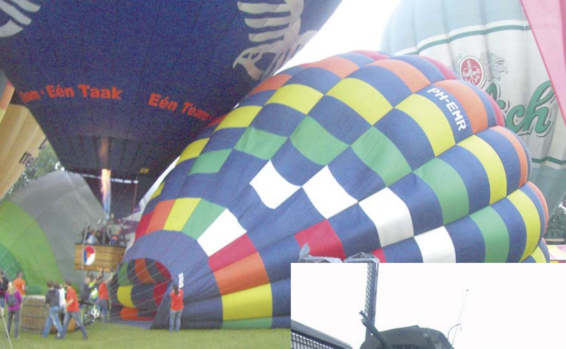
Vorbereitung für den Ballonstart