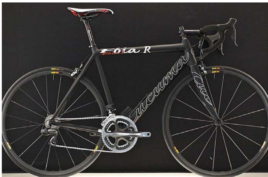
Fioa R: Abbildung ähnlich der Angebotenen Räder