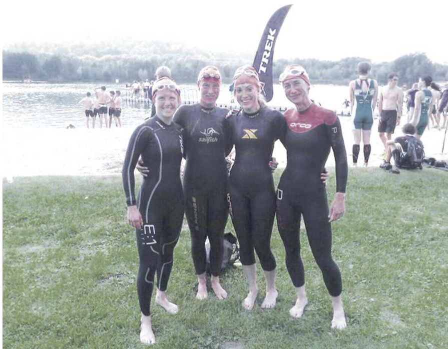
Die Mannschaft vor dem Schwimmstart