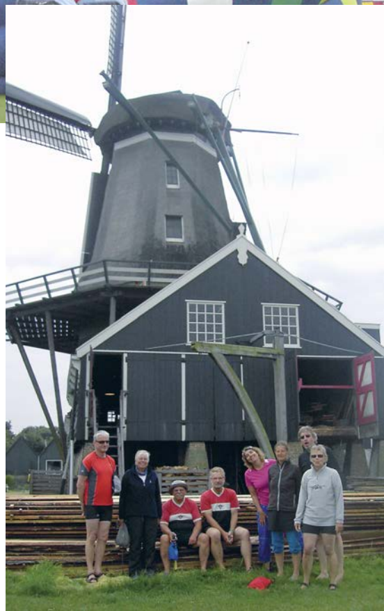
Gruppenbild vor der Sägemühle links: Warten in der Schleuse