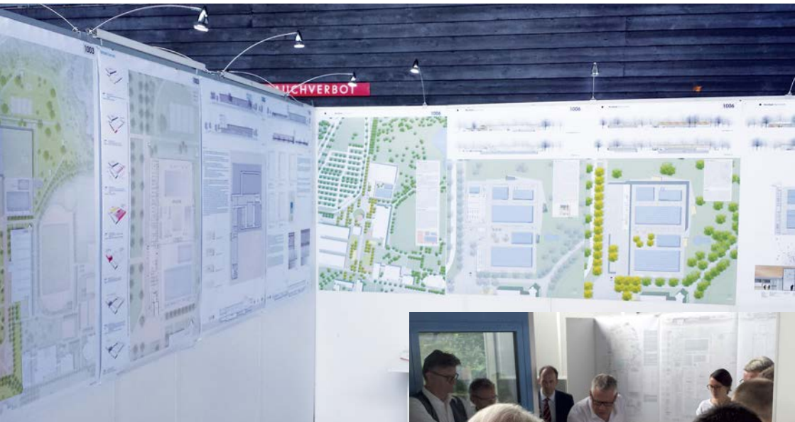
Stellwände im Nordbad mit den Entwürfen

benen Entwürfen, die im Nordbadfoyer ausgestellt waren, die vier besten ausgewählt. Nachdem neun Entwürfe in zwei Runden ausgeschieden waren, wurde im letzten Schritt die Rangfolge dieser verbleibenden Entwürfe festgelegt.