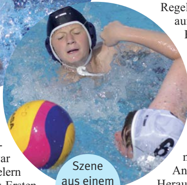
Szene aus einem U13-Spiel

Darmstadt hatte in Zusammenarbeit mit dem Schwimmbadclub Traisa eingeladen. Und der Erfolg war überwältigend: Neben den Spielern des WVD und den Gästen des Ersten Offenbacher Schwimmclubs beteiligten sich 34 Mädchen und Jungen, die Wasserball einfach mal kennenlernen wollten, am Schnupperturnier. Die „Schnupperkinder“ kamen zum großen Teil aus Mühlthal, Darmstadt und Griesheim. Aber auch Ober-Ramstadt, Alsbach-Hähnlein, Bickenbach,