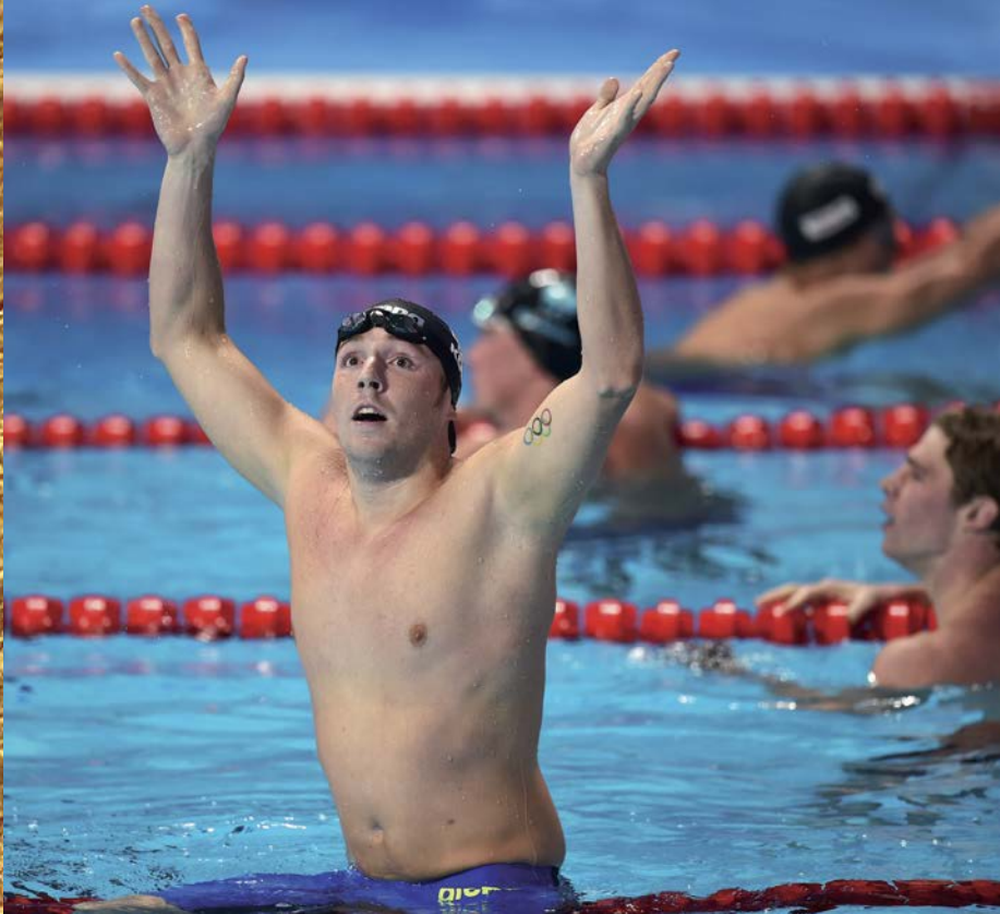
Erschöpft, aber WELTMEISTER