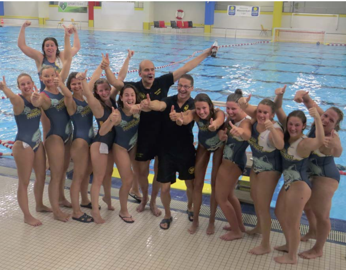
So sehen Sieger*innen aus.