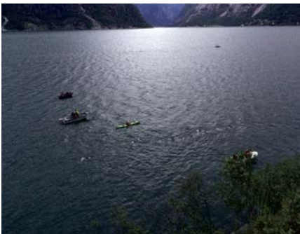
Schwimmen im kalten Fjord

Radhose, Tria-Top, Helmmütze und Armlinge. Mit meinem Support-Team, dem auch Tobi und Maik angehören, ist vereinbart, dass wir uns bei Kilometer 20 zum ersten Mal treffen. Fehleinschätzungen bei der Bekleidung können so recht schnell korrigiert werden. Es geht mit dem Rad erst flach und dann immer steiler aus dem Städtchen hinaus. Wir radeln auf der großen Landstraße, die durch viele Tunnel führt. Die Triathleten umfahren die Tunnel auf Radwegen, die einzigartige Blicke in eine Schlucht mit einem reißenden Fluss ermöglichen. Ein Teil dieser Rad-Route ist wegen eines Erdrutsches aber gesperrt. Das Feld der Radler muss auf die Straße ausweichen, die Tunnel werden für Autos gesperrt. Und das hat fatale Folgen. Manche Support-Teams sind schon durch, meines steckt im Stau. Andere Wettkämpfer erhalten Verpflegung und warme Klamotten, ich fahre weiter. Km 30, Km 40 – noch nichts von meinen Jungs zu sehen. Ich bin fast oben, es wird neblig, fängt an zu regnen. Langsam geht mir meine Notverpflegung aus. Auf dem Gipfelpass fahren die Radler rechts ran und lassen sich versorgen. Ich radle weiter. Der Regen ist noch stärker geworden. Ich zittere und kann kaum noch den Triathlon-Lenker halten. Die Luft hat nur noch vier Grad. Ich habe noch einen Riegel und etwas Gel in der Flasche. Mittlerweile bin ich bei Kilometer 60. Langsam