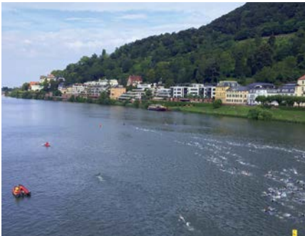
Schwimmen im Neckar.

Auf dem Rad gilt es zweimal den Königsstuhl zu bezwingen und auf einer Strecke von 35 km eine Höhendifferenz von 850 Höhenmetern zu überwinden – das Herzstück des Rennens. Hier fackelte ich