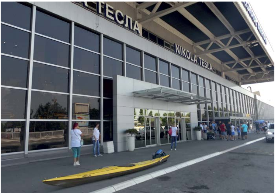
Am Flughafen Belgrad.