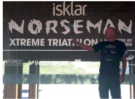
Stolzer Besitzer des schwarzen T-Shirts.

Fazit: Die Strapazen haben sich gelohnt. Der Norseman ist ein außergewöhnlicher Triathlon in einer traumhaften Landschaft. Die Organisatoren haben mit ihrer Definition recht: „It’s not a competition, it’s an experience.“ Wer starten will, benötigt aber