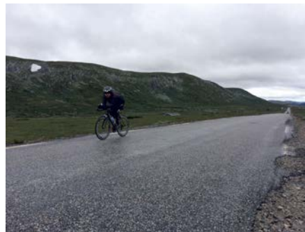
No-Drafting Rennen :)