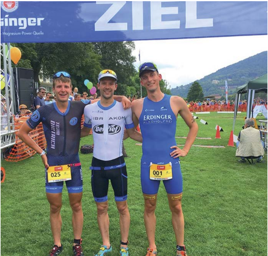
Vom Heidelberger Publikum herzlich empfangen und im Ziel.