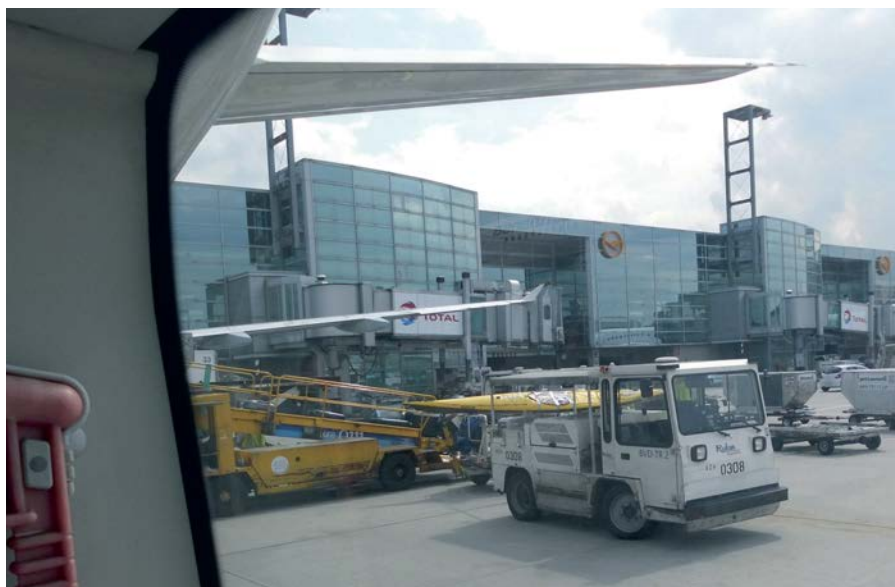
Ankunft am Flughafen Frankfurt am Main.