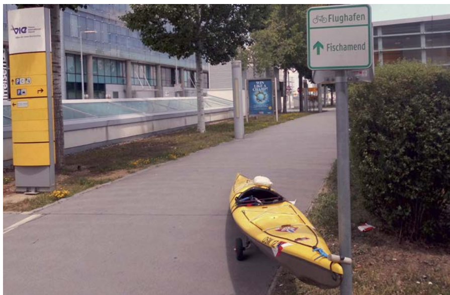
Auf dem Weg zum Wasser.

und 20 kg Gewicht. Aufpreis am Flughafen zahlbar. (100 € pro Strecke, wie sich herausstellte). Ein weiteres Gepäckstück mit max. 32 kg Gewicht war kostenfrei zulässig. Na geht doch. Jetzt musste ich noch einen hilfsbereiten Freund finden, der mich mit Boot und Auto zum Frankfurter Flughafen und das Auto dann wieder weg bringt. Hilfreich wäre gewesen, wenn die Lufthansa vorher gesagt hätte, dass der Sperrgepackschalter Nr. 444 in Halle B am anderen Ende des Abflugbereiches zu finden ist, dann hätten wir das andere Parkhaus benutzt. So mussten wir die 500 m quer durch alle Menschen an den Abflugschaltern und unter lächelnden bis erstaunten Mienen laufen. Vielen dank an Benno, der die Schlepperei ohne Proteste mit gemacht hat. Am anderen Ende, in Wien, gaben mir die netten Paddler und Naturfreunde lange vorher per Mail die Auskunft, ich wäre zu Fuß schneller an der Donau, als sie aus der Stadt in Schwechat. Tatsächlich liegt der Flughafen direkt an