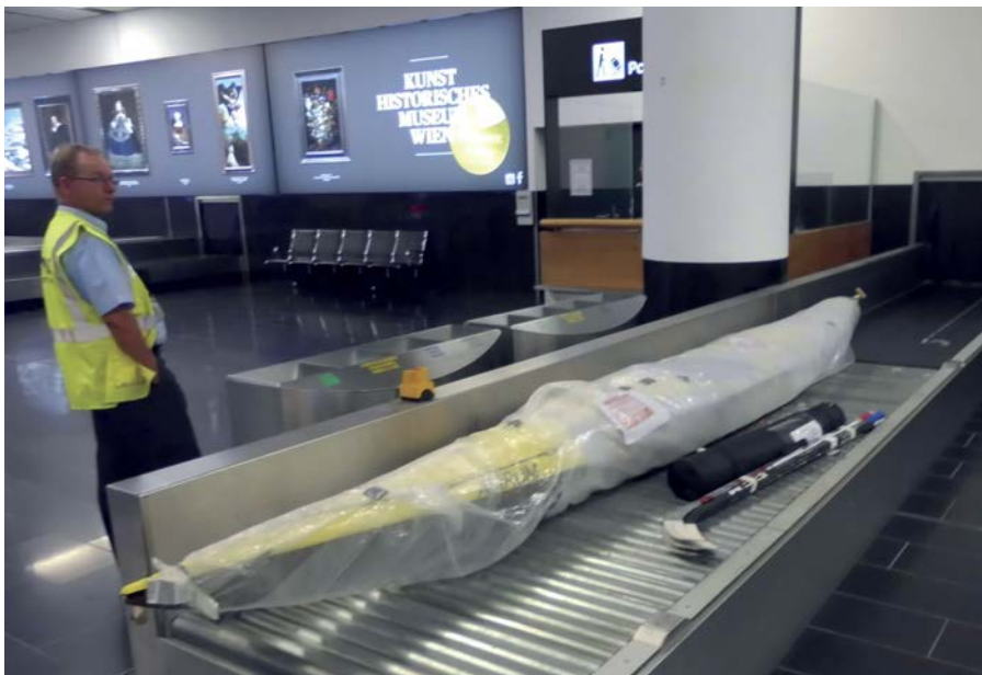
Seekajak „Amrum“ landet wohlbehalten in Wien.

Also dachte ich über andere Möglichkeiten nach. In einem Kanublog hatte ich davon gelesen, dass Kajaks als Sportgepäck im Flugzeug aufgegeben wurden. Bei der Buchung war das Reisebüro sehr skeptisch. Aber dann kam von der Lufthansa eine schriftliche Bestätigung über ein Sportgepäck mit 530 x 60 x 40 cm Ausmaß