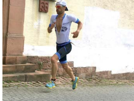
Lauf auf dem Philosophenweg.