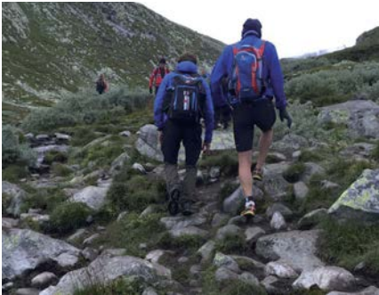
Den Gipfel hoch

camp, bei der Startnummernausgabe oder im Café gab es nur ein Thema. Alle wollen das schwarze Finisher-T-Shirt haben. Das bekommen aber nur die Triathletinnen und Triathleten, die es auf den Gipfel des Gaustatoppen geschafft haben. Nur 160 Starter werden hochgelassen und es gibt eine Cut-Off-Zeit bei der 32,5 km-Marke. Mein Team beruhigt mich. „Du liegst gut laut Live-Tracking“, höre ich. Nach 25 km kommt der Berg der Entscheidung. Es geht