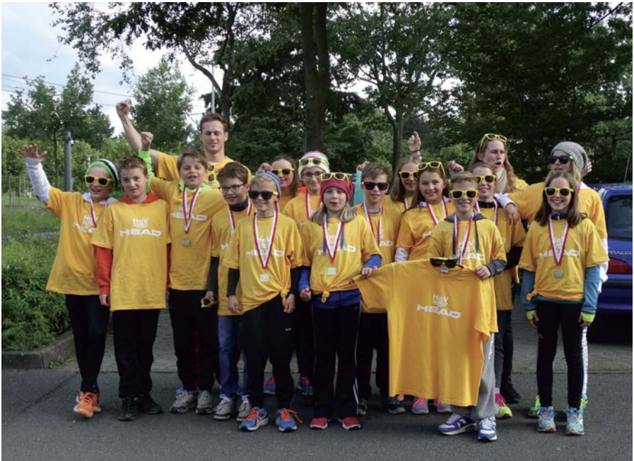
Müde, aber glücklich, die siegreiche Kindermannschaft des Bezirk Süd nach ihrem historischen Sieg.