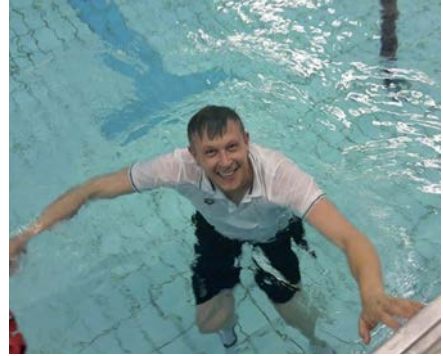
Traditionen müssen gepflegt werden: Nach dem Aufstieg muss der Trainer baden gehen.