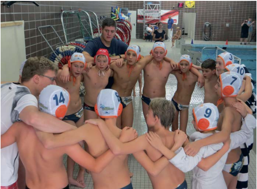
Das Jungs-Team des WVD