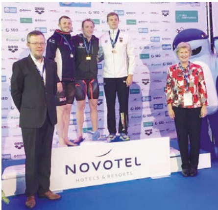
Marco Koch mit dem 6. Sieg in Folge über 200m Brust beim EuroMeet.

Eine Woche nach dem letzten Test in Antwerpen konnte unser Europameister von 2014 Marco Koch beim Euro Meet in Luxemburg erfolgreich an seinem Nachfolger Ross Murdoch (GB) Revanche nehmen und in 2:09,49 mit über 3 Sekunden Vorsprung das Finale über 200m Brust für sich entscheiden. Der Versuch die vom Deutschen Schwimmverband vorgegebene Norm (2:08,20) für die diesjährigen Titelkämpfe in Glasgow zu erreichen schlug jedoch fehl. Auf den ersten drei Bahnen lag Marco noch