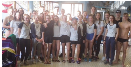
Sämtliche Oberligateams im Bad in Frankfurt-Höchst.