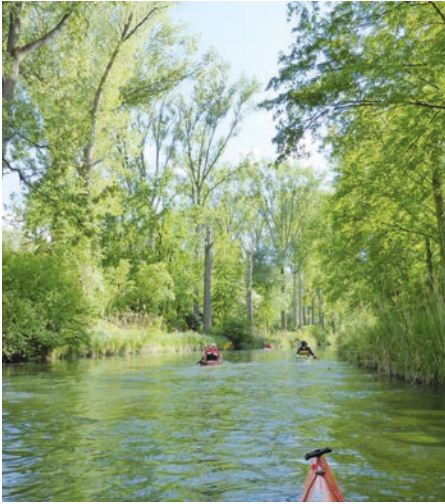
Urwald vor der Haustür.