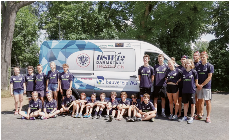
Nachwuchsatleten aus dem DSW Merck-Jugend-Team