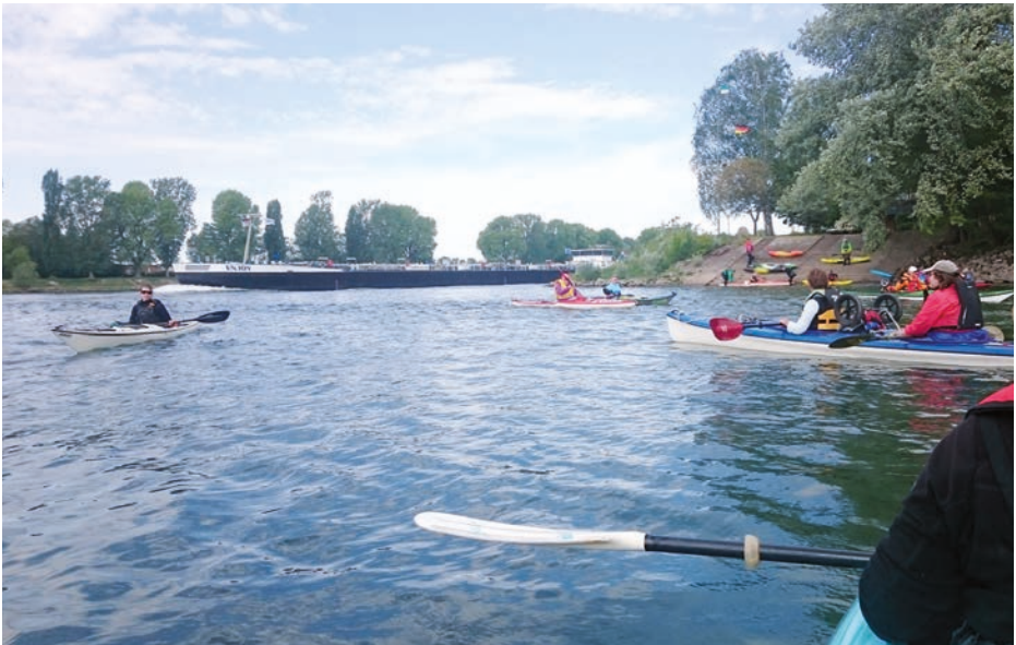
Einstieg mit Blick auf die Rheinschiffahrt.

Am Samstag stand die „Otterstädter Runde“ auf dem Programm. Gestartet wurde am herrlich auf einer Landzunge gelegenen Bootshaus des Wassersportvereins Brühl. Es dauerte seine Zeit, bis die achtzehn Kanuten ihre Einer und Zweier abgeladen und zu Wasser gelassen hatten. Ein Blick zum wolkenverhangenen Himmel ließ es ratsam