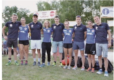
Die Erfolgreiche Athletinnen und Athleten des Rothsees.