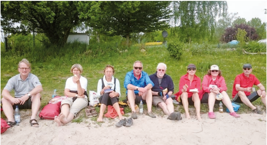
Pause muss sein.

erscheinen, die Spritzdecken zu schließen.