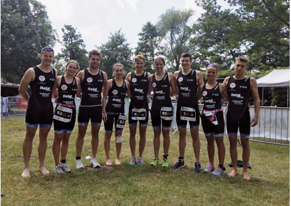
Die erfolgreichen Teams aus der 2. Bundesliga