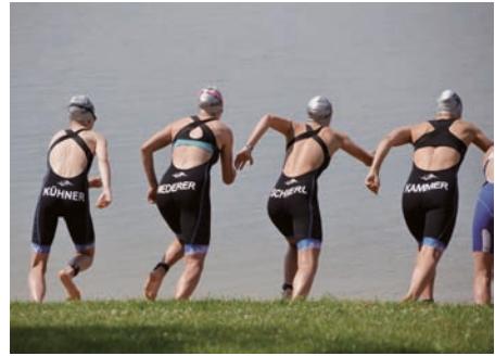
Das Damen Team startet in den Wettkampf

Auch wenn am Rothsee der Heimvorteil fehlte, konnten gleich nach dem Schwimmen sehr gute Ausgangspositionen festgehalten werden. So kam Finja, die jüngste