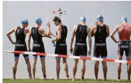
Die Herren kurz vor dem Start