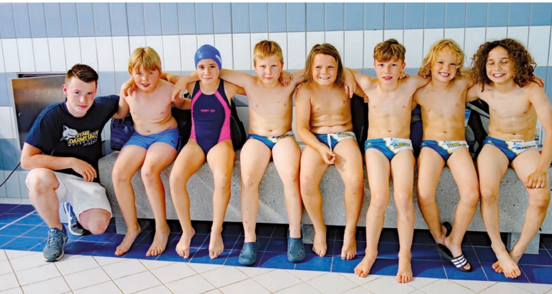
Die Mannschaft der „Unterzehnjährigen“ – U10.