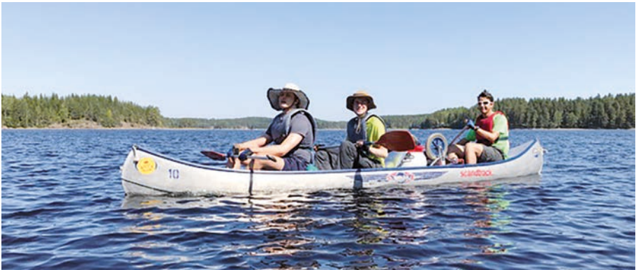
Traumhaftes Wetter, leichte Wellen, gute Laune.