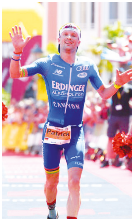
Patrick Lange läuft beim Ironman Frankfurt auf Platz 3