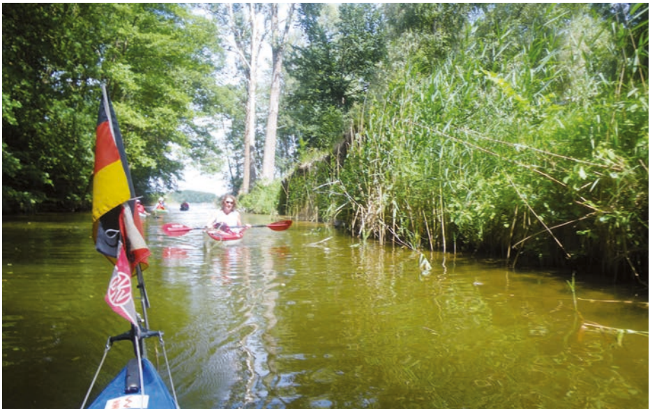
Schmale Durchgänge von See zu See.

Eigentlich eine schöne Strecke, aber wir müssen an der Schleuse im Kammerkanal 1 Stunde warten, es gibt diverse Motorboote. Dann haben wir keine Zeit mehr, Neustrelitz anzuschauen. Das Städtchen war die