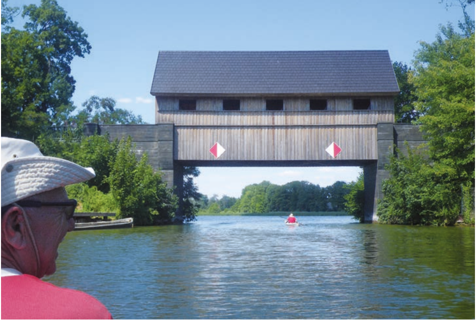
Hier gehts zum Räucherfisch.

15 Teilnehmer, 6 Autos, Ediths Camper, 2 Wohnwagen, 3 Zweier und 7 Einer auf den Autodächern, 2 Hunde. Unterkunft in 3 Ferienwohnungen, 4 Zelten und den Wohnwagen. Man sieht schon, dass allein die Organisation dieses sehr gemischten Trecks für den Fahrtenleiter Werner Ihl eine Herausforderung war.