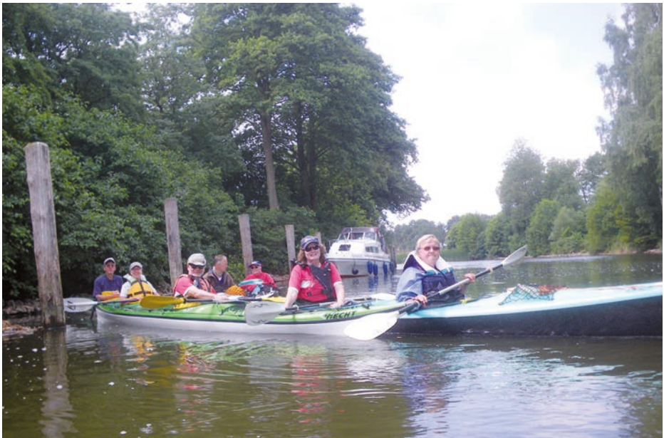
Sammeln vor der Schleuse.