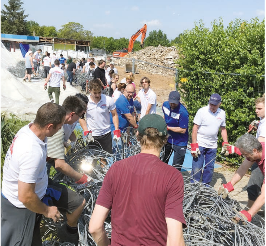
Mit vereinten Kräften wurden die Stahlnetze auf Paletten gewickelt.