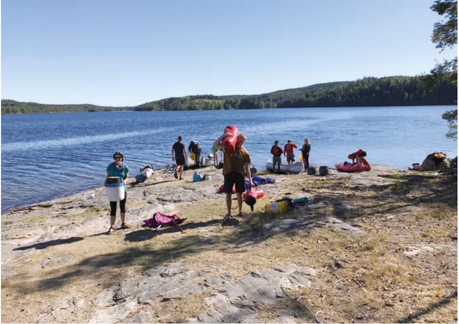
Übernachtungsplatz gefunden, Boote können entladen werden