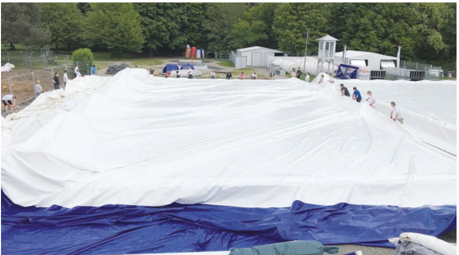
Zug um Zug wurden die Folien der Traglufthalle von der Seite der Startbrücke über Wettkampf- und Nichtschwimmerbecken gezogen.