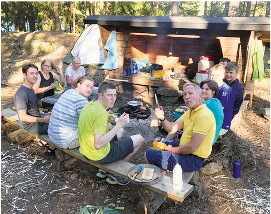
Koch- und Essplatz

Und Elche? Gesehen haben wir keine, obschon man überall die Losung der großen Tiere finden konnte. Wir hielten uns dann auf der Heimfahrt schadlos mit dem Einkauf