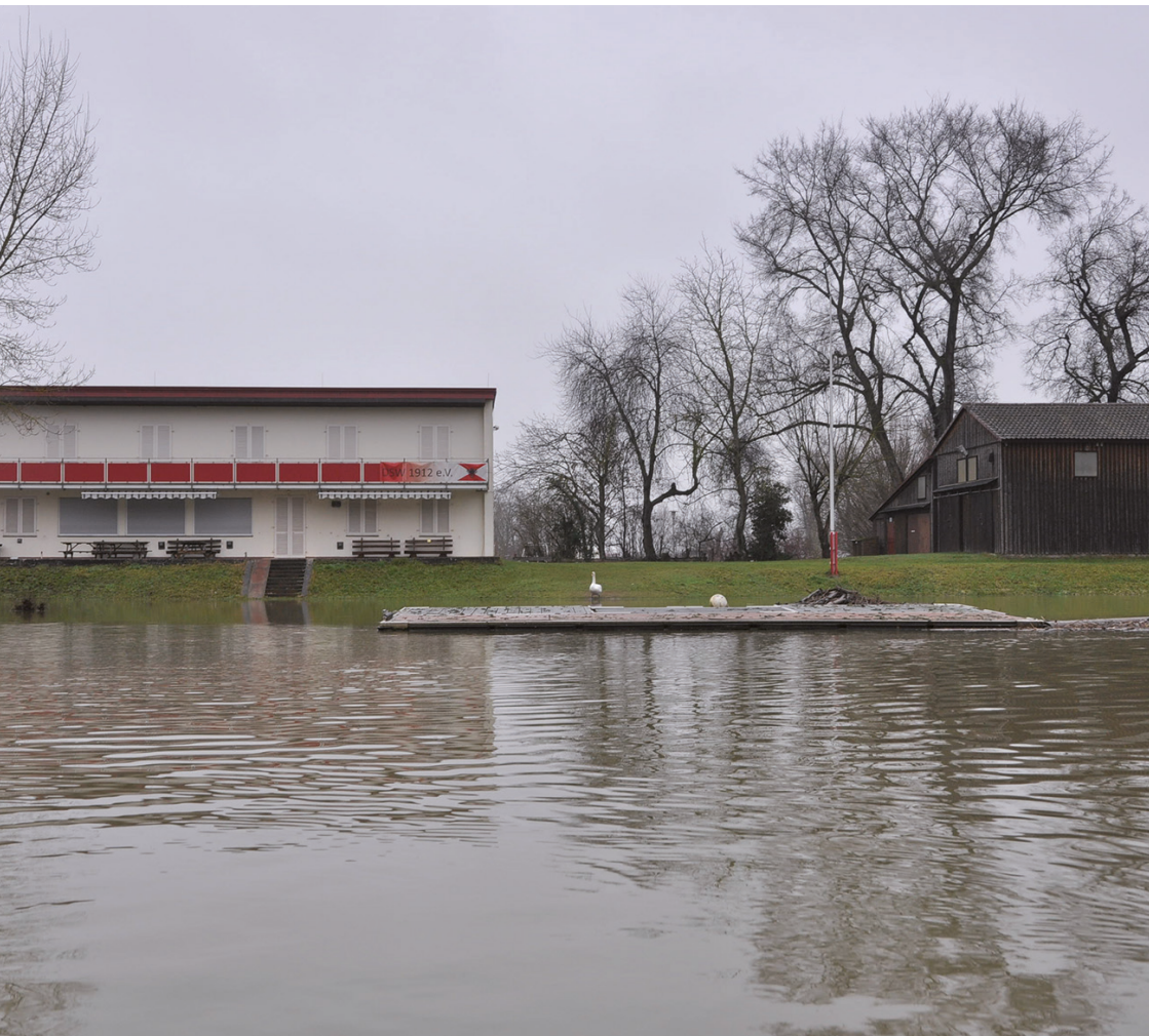
Das Bootshaus nur auf dem Wasser erreichbar

dung des Altrheins aussieht. Auch hier Wasser so weit das Auge reicht. Von der gemauerten Uferböschung ist nichts zu sehen. Das weiß-rote Einfahrtsschild ragt verloren aus der Flut. Durch den hohen Wasserstand ist die Fließgeschwindigkeit relativ niedrig, so dass es leicht ist, auf den Neurhein hinauszupaddeln. Auch auf dem Fluss ist die Strömung am Rand nur mäßig, so dass man in aller Ruhe die Kühkopfaunen betrachten kann, die sich