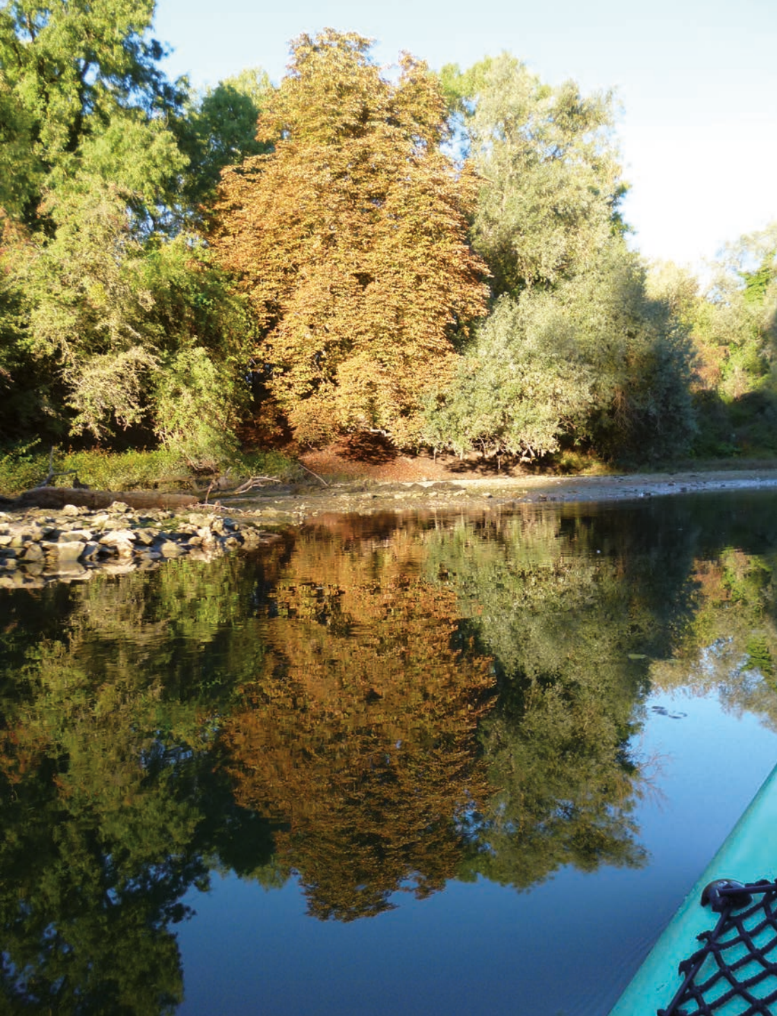
im Erfelder Altrhein