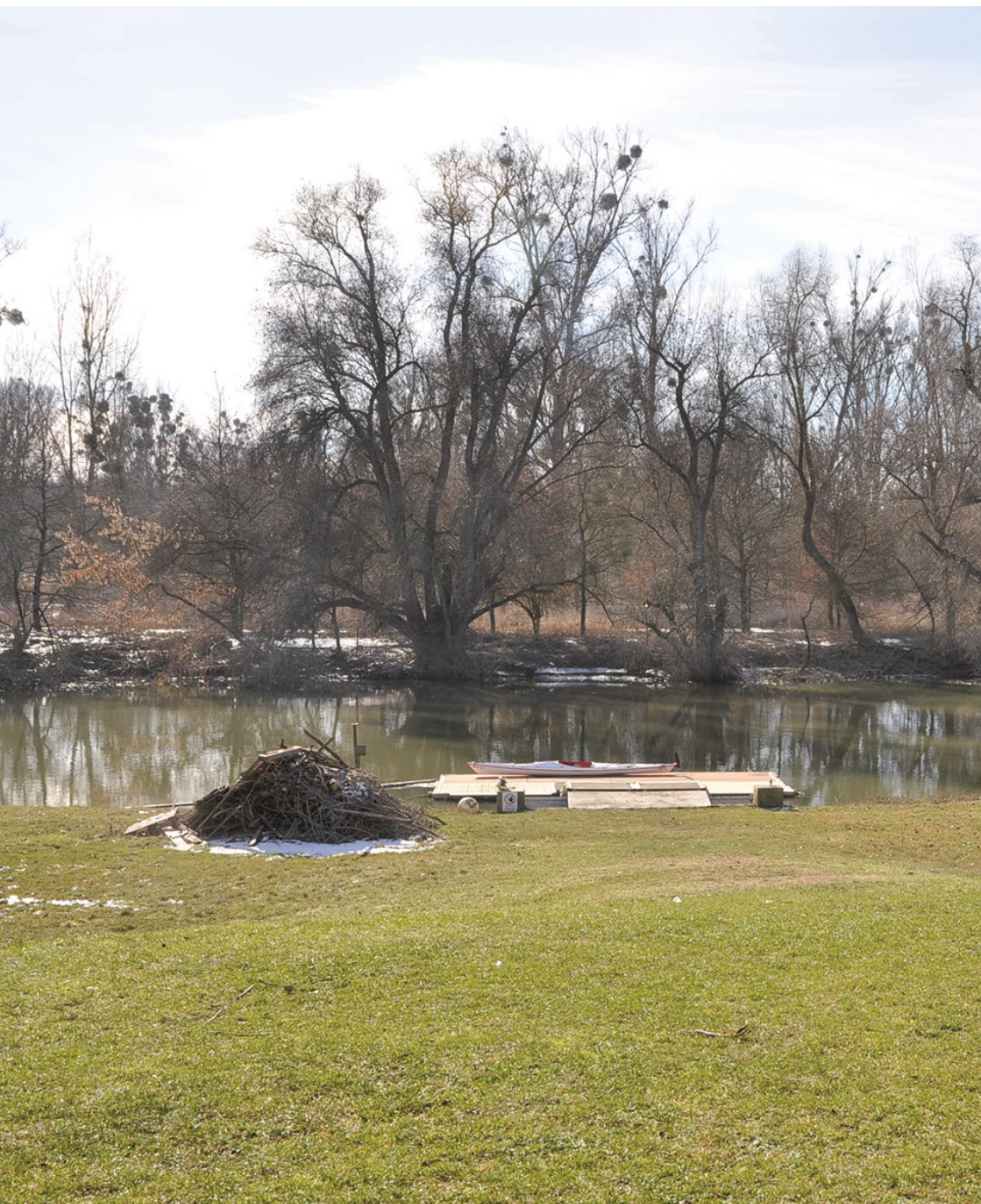
Eine Woche später Pegelstand 315