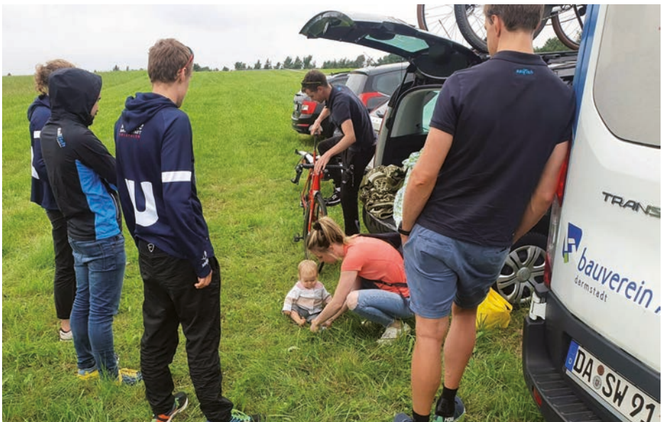
Vor dem Rennen: die Supporter werden begrüßt.

Also eingeeckelt und eingelaufen, zum Einschwimmen war's zu kalt. Jedenfalls standen wir kurz nach drei am Schwimm-Einlass, alle waren motiviert, alle hatten noch Gel-Monsterle – selbstgemischte Pampe verdrückt, alle waren auf dem Klo – also top Voraussetzungen. Wir stellten uns in die ganz linke Box mit dem vermeintlich kürzesten Weg zur Boje, dann ging's auch schon los. Im Wasser unterschieden sich Selbst- und Fremdwahrnehmung wie folgt: Start und Weg bis zur ersten Boje waren