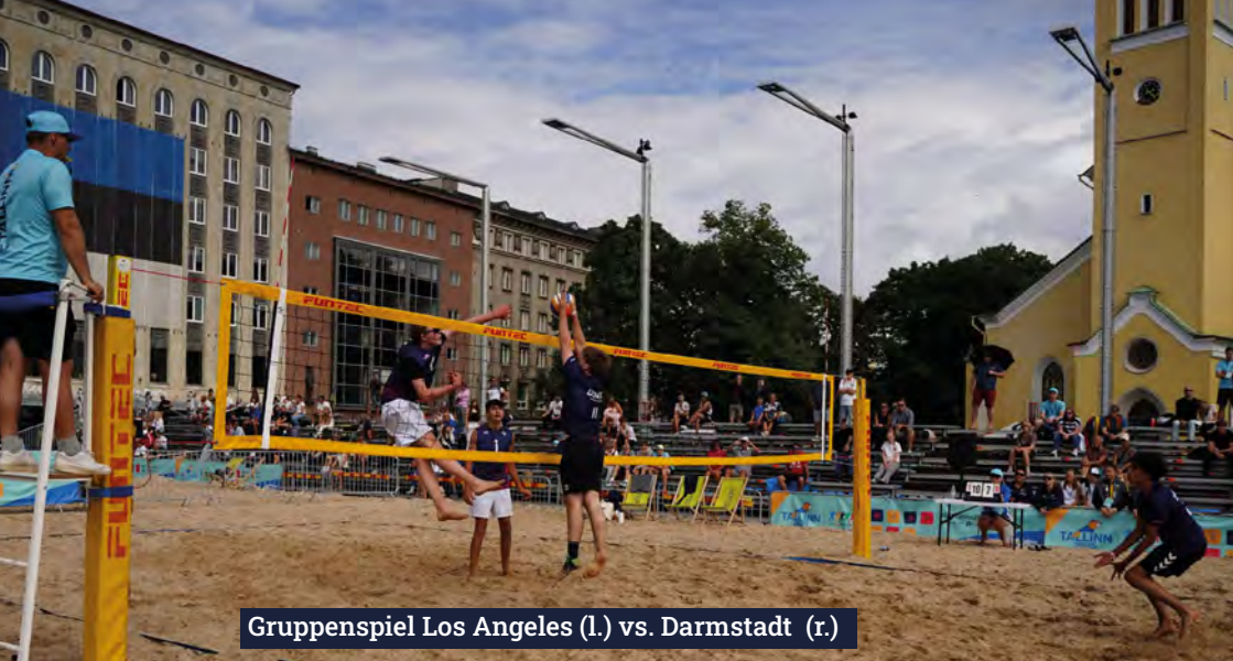
Gruppenspiel Los Angeles (l.) vs. Darmstadt (r.)