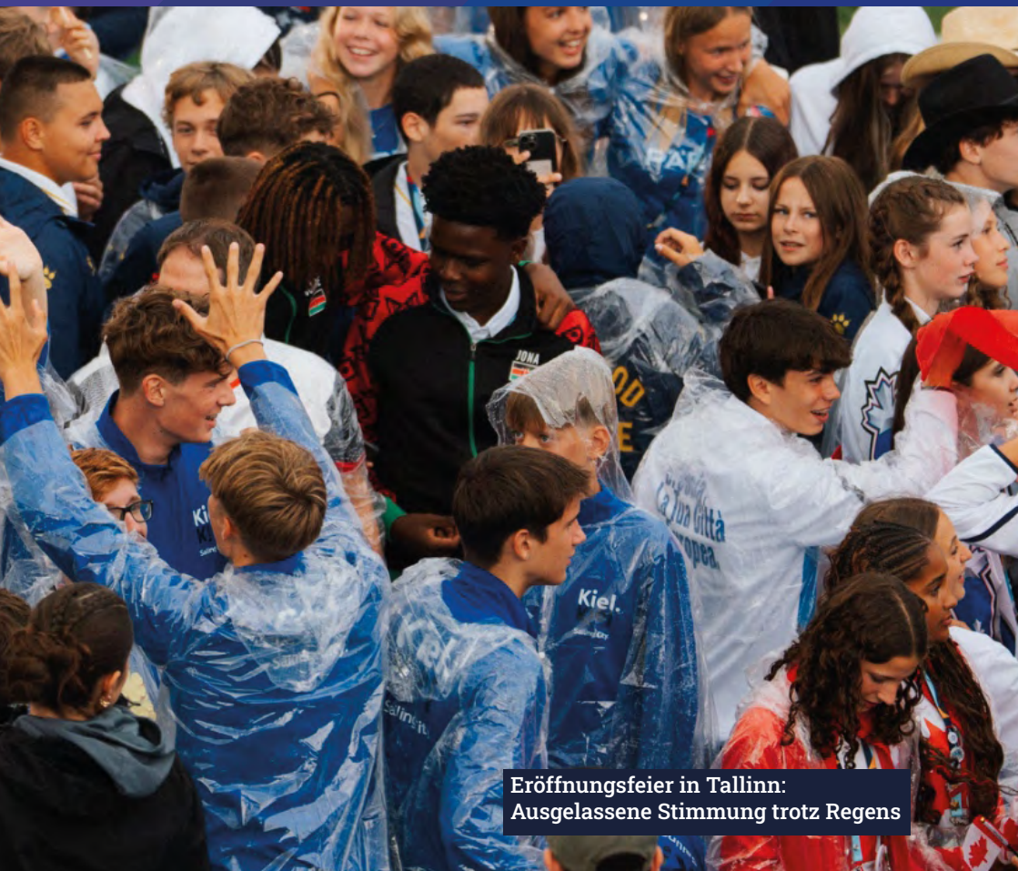
Eröffnungsfeier in Tallinn: Ausgelassene Stimmung trotz Regens